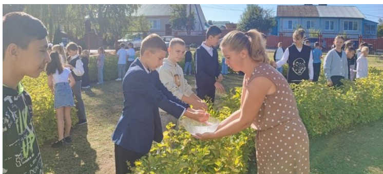
Акция «Капля жизни»