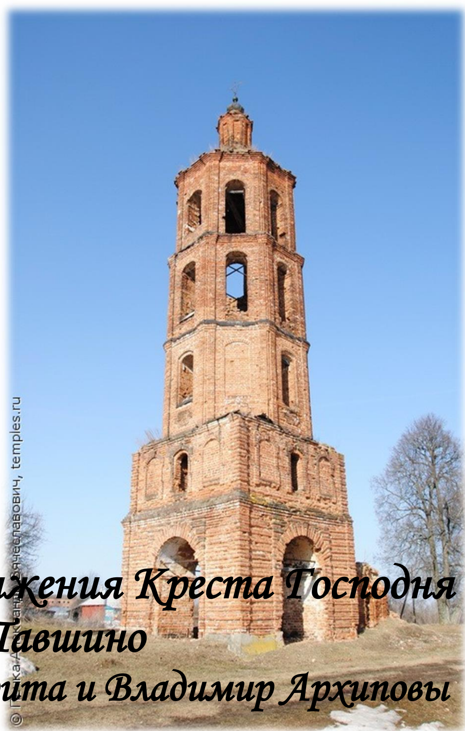
Колокольня церкви Воздвижения Креста Господня с. Новое Павшино