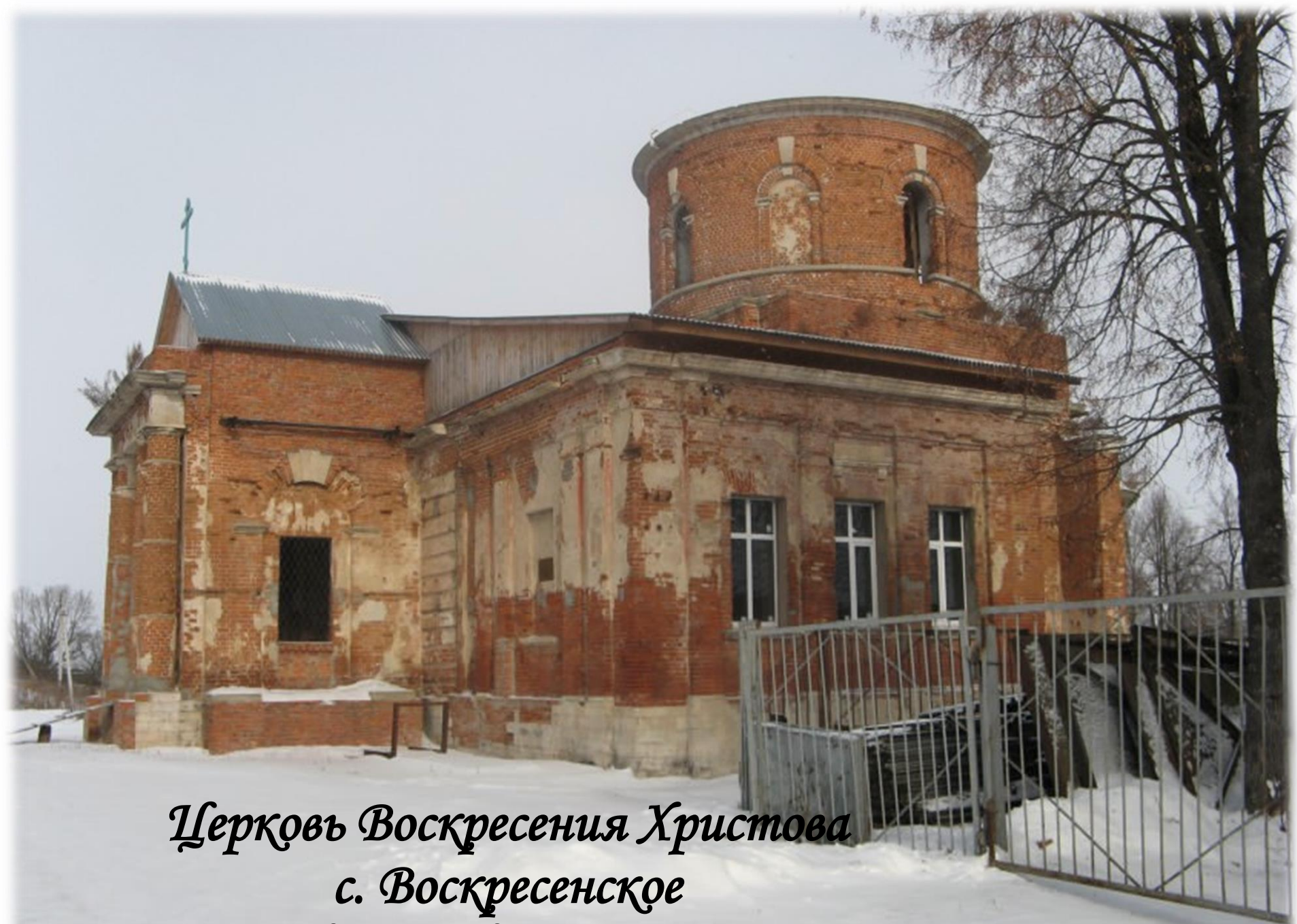
Церковь Воскресения Христова с. Воскресенское